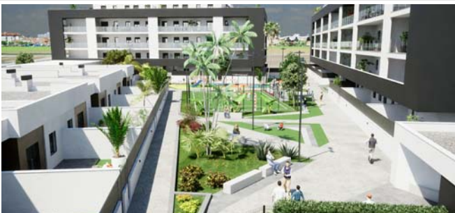
INFOGRAFÍAS NO VINCULANTES